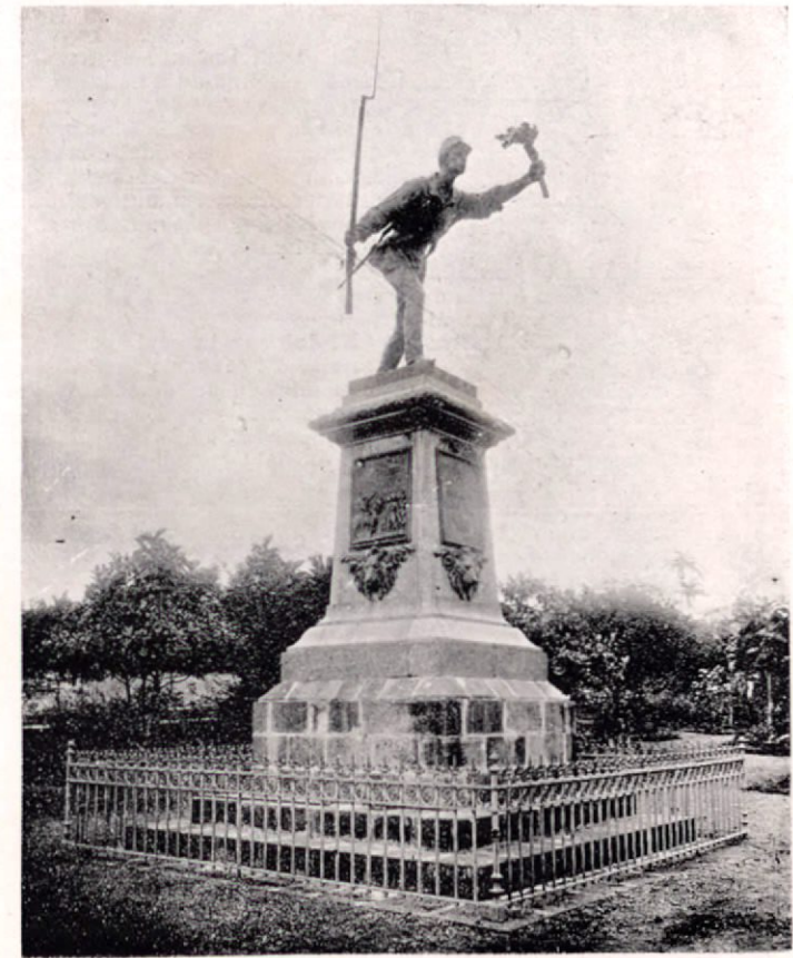
Estadua de Juan Santamaría, en el Parque de Alajuela

N UESTRO grabado representa la estatua que en su ciudad natal, Alajuela, se levantó hace algún tiempo al soldado heróico que, para dar fin con un triunfo completo para nuestras armas al sangriento combate del 11 de abril de 1856, prendió fuego al Mesón de Rivas, donde se hallaban parapetados los filibusteros, y dió así la victoria á nuestro ejército. El héroe quedó muerto al ejecutar aquel acto memorable que nuestra historia recuerda con orgullo y gratitud.